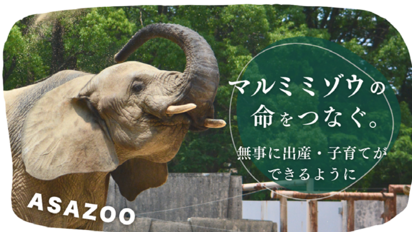
「メイ」推定25歳 マルミミゾウのメス